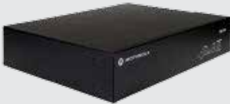
Controlador XRC 9100 Connect Plus