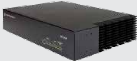
Gateway XRT 9100 Connect Plus