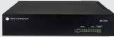
Gateway de Interconexão XRI 9100 Connect Plus