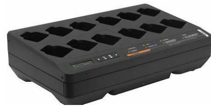
CARREGADOR MÚLTIPLO IMPRES 2 PARA 12 UNIDADES