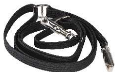
Alça de ombro, náilon

Para prender nos anéis tipo D dos estojos. Compatível com todos os rádios portáteis