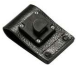
Presilha giratória para cinto de 2"