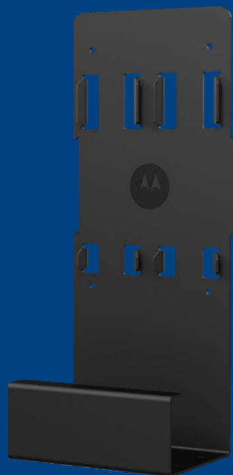
SUPORTE DE MONTAGEM