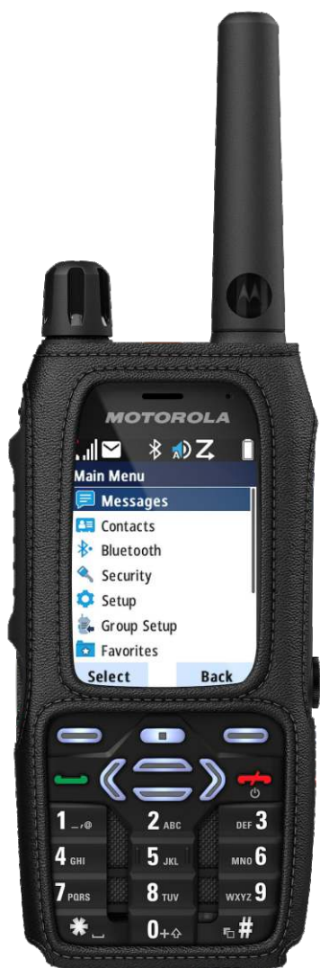
ESTOJO DE COURO FLEXÍVEL (O RÁDIO É VENDIDO SEPARADAMENTE)

Não importa se os membros de sua equipe preferem usar o rádio no ombro, no peito ou na cintura, contamos com uma variada gama de acessórios de transporte para atender às suas necessidades específicas. Essa gama inclui estojos de couro, correias, acessórios de ombro e presilhas para cinto, todos projetados para um acesso fácil e seguro ao rádio MXP600, para que sua equipe possa ficar de mãos livres e concentrada no trabalho.