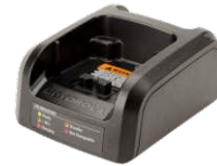
CARREGADOR DE MESA

Carregue seu rádio e bateria de reposição simultaneamente. O conector faz parte do kit. Suporta a carga sequencial do rádio primeiro e da bateria de reposição depois.