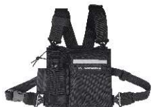
Colete de retirada rápida e porta rádio

Com porta rádio, porta caneta e bolso com velcro. Compatível com todos os rádios portáteis