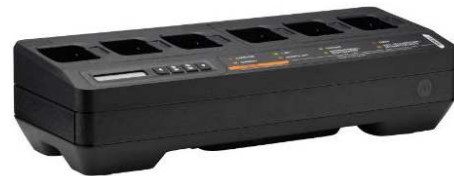
CARREGADOR MÚLTIPLO IMPRES 2 PARA 6 UNIDADES